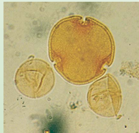
Figur 2.13 Pollen i aflejringer på bunden af søer fortæller om fortidens plantevækst og derigennem om klimaet.

Næste trin er at identificere pollenkornene ned gennem borekernen ved at studere dem i et mikroskop. På den måde bestemmes skiftende plantevækst tilbage i tiden. I Frankrig er det lykkedes at udbore søbundskerner, som indeholder kontinuerte tidsserier af pollen, som viser klimaets udvikling gennem de seneste 140.000 år.